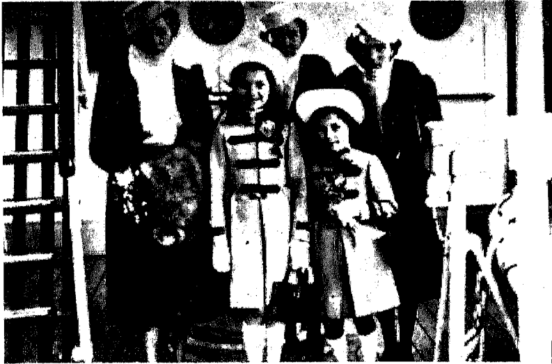
الأميرات الأربعة .. بنات الملكة نازلى فى لقطه تذكارية على إحدى السفن